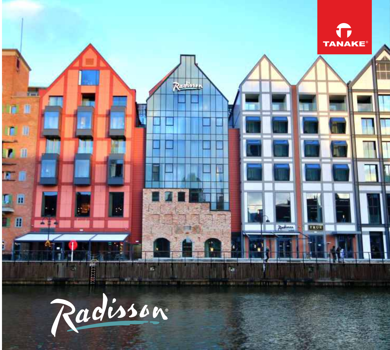
Radisson Hotel & Suites Gdańsk