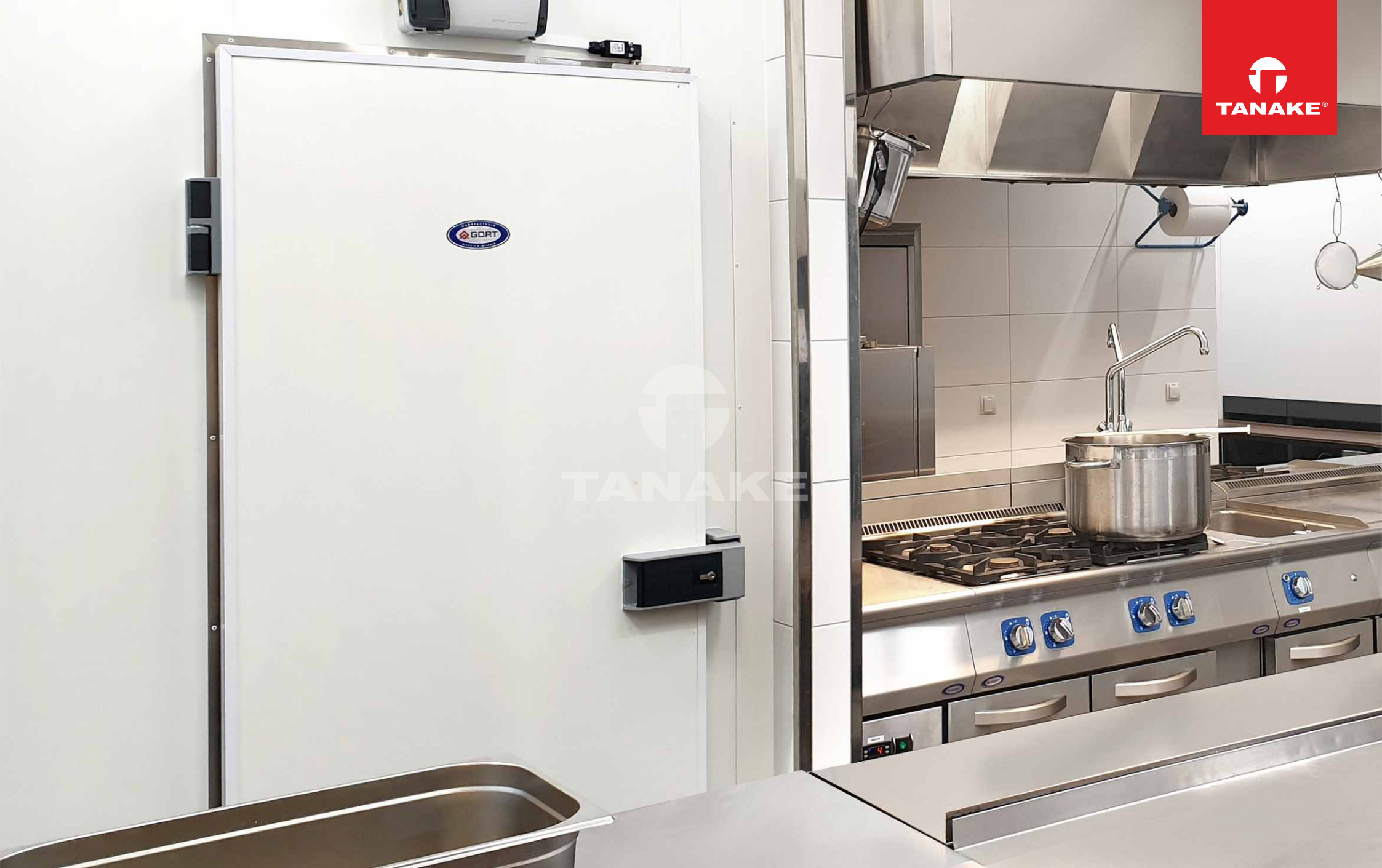
Zaplecze kuchenne - komora chłodnicza, urządzenia grzewcze.