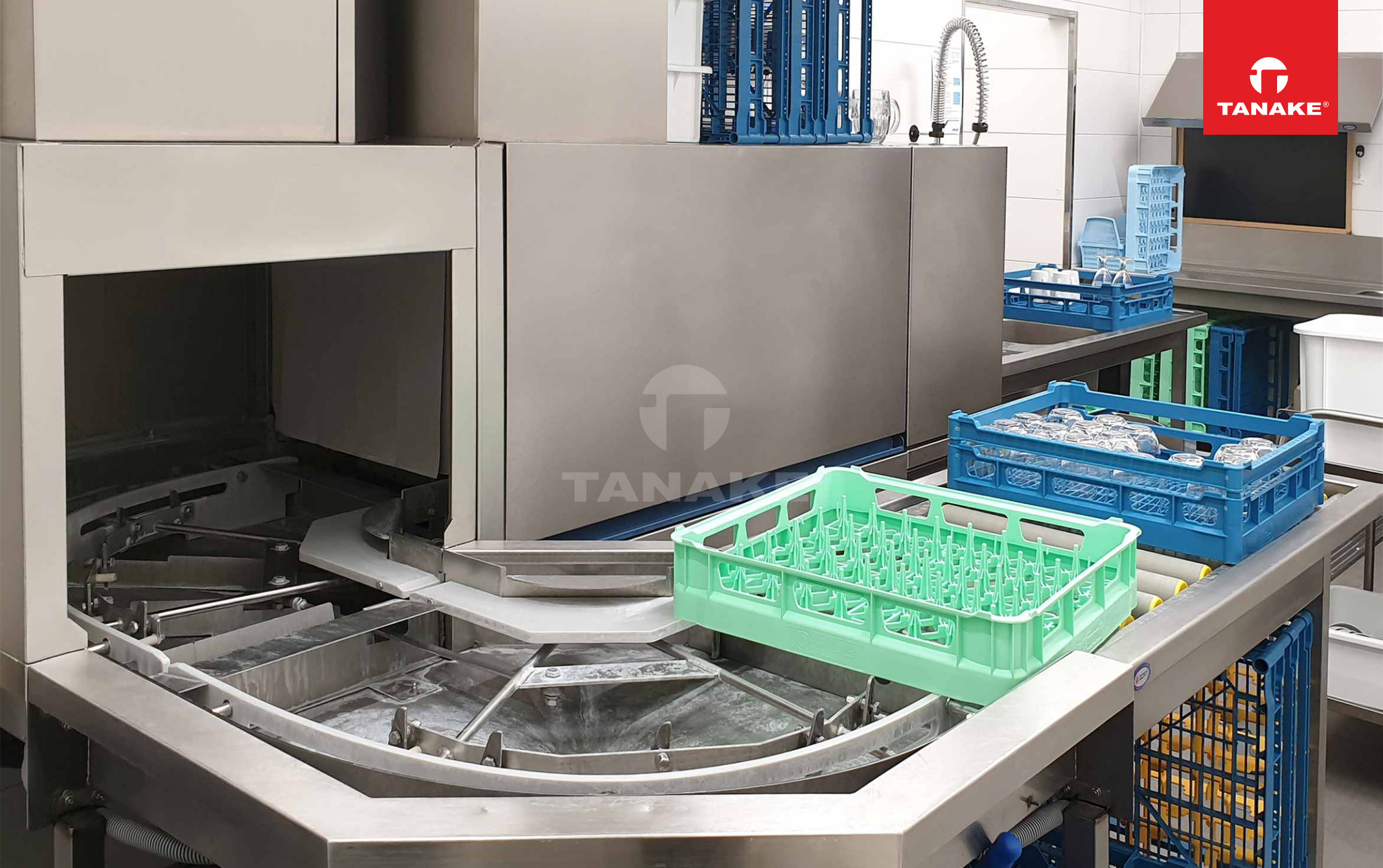
Zaplecze kuchenne - zmywarka tunelowa.