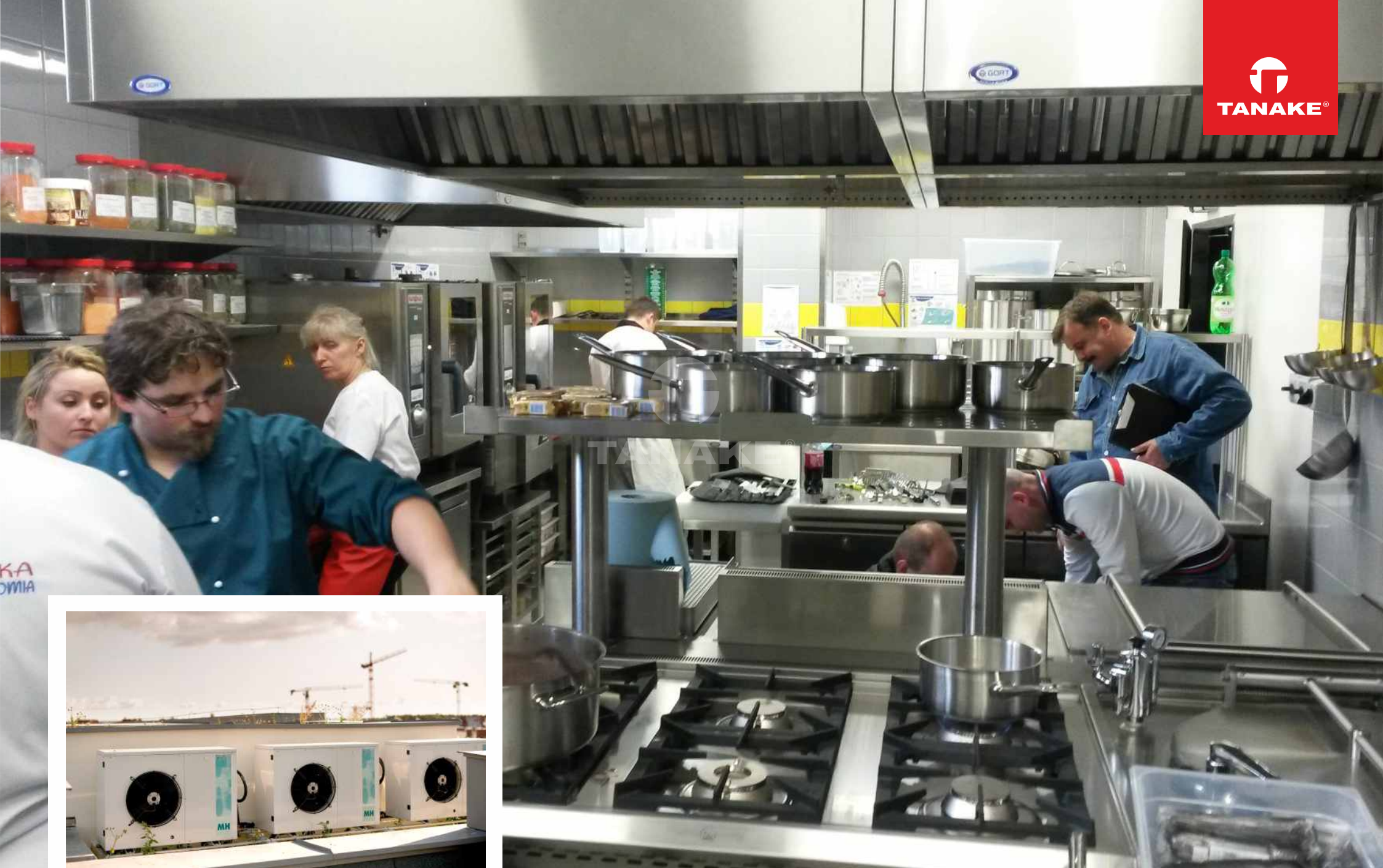
Funkcjonalna kuchnia. W jej pobliżu są również usytuowane komory chłodnicze. Agregaty, które je zasilają zostały wyprowadzone na dach. Mają piękny widok na morze :)